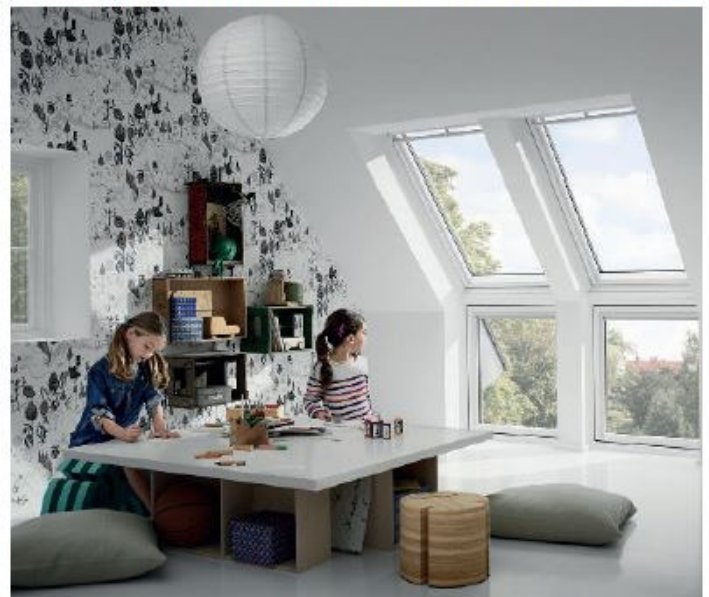
Großzügige Fensterlösungen von Velux verlängern die Lichtfläche bis zum Boden und bieten den Kleinsten einen Ausblick bis zum Horizont, ohne dass ihre Eltern Angst vor ungewollten Fehlritten haben müssen.

leiste für Erwachsene selbst dann bequem zu bedienen ist, wenn der Spielteppich direkt unter dem Fenster liegt, ist sie für Kinder in unerreichbarer Höhe – auch bei niedriger Einbauhöhe der Fenster von 90 Zentimetern. Eine Verschluss-hülse im oberen Bereich des Fensters ermöglicht es darüber hinaus, die Schwingfunktion des Fensters bei Bedarf zu blockieren. Ganz auf Nummer sicher gehen Eltern mit nachrüstbaren Öffnungsbegrenzern oder Sicherheits-Verschlüssen, die ein Öffnen des Fensters nur mit dem passenden Schlüssel erlauben. Und wer zugleich die Sicherheit seines Zuhauses erhöhen möchte, schlägt mit Dachfenstern in der Variante „Einbruchschutz“ zwei Fliegen mit einer Klappe: Sie sind von innen abschließbar und gewährleisten so nicht nur den sicheren Ausblick für die Kleinsten, sondern schützen darüber hinaus das Haus oder die Wohnung auch vor unbetenen Eindringlingen. Tipps und Infos rund um den sicheren Ausblick für die Kleinsten finden Sie auch unter www.velux.de .